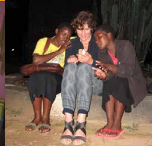
Desire en Doreen bekijken foto's uit Nederland