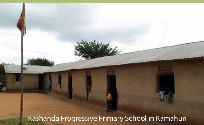
Kashanda Progressive Primary School in Kamahuri

weersomstandigheden, maar de school krijgt geen geld van de overheid. Ook de lesmaterialen zijn erg beperkt. We willen dit jaar vanuit onze stichting een bijdrage leveren aan betere lesmaterialen op de school, zoals lesboeken en leskaarten voor aan de muur. Ondanks de beperkte middelen zijn de resultaten van de leerlingen prima en toonden de directeur en leerkrachten zich gemotiveerd om goed les te geven.